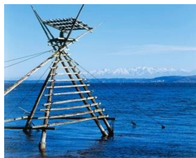
「能登の里山里海」は世界農業遺産に認定

2017年5月から穴水町移住定住支援員として活動中。小学6年から4年間穴水町で過ごした経験があり、第二の故郷のために役に立ちたいと、協力隊に志願。現在はデザイナーとして活躍してきた経験を活かして穴水町の魅力を発信している。