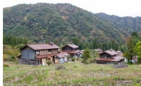
※山中温泉東谷地区の紹介は裏面を参照